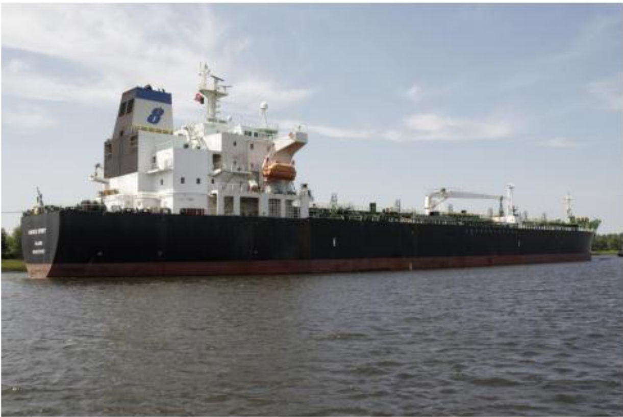
Een enorm groot schip verlaat de haven op weg naar de Noordzee