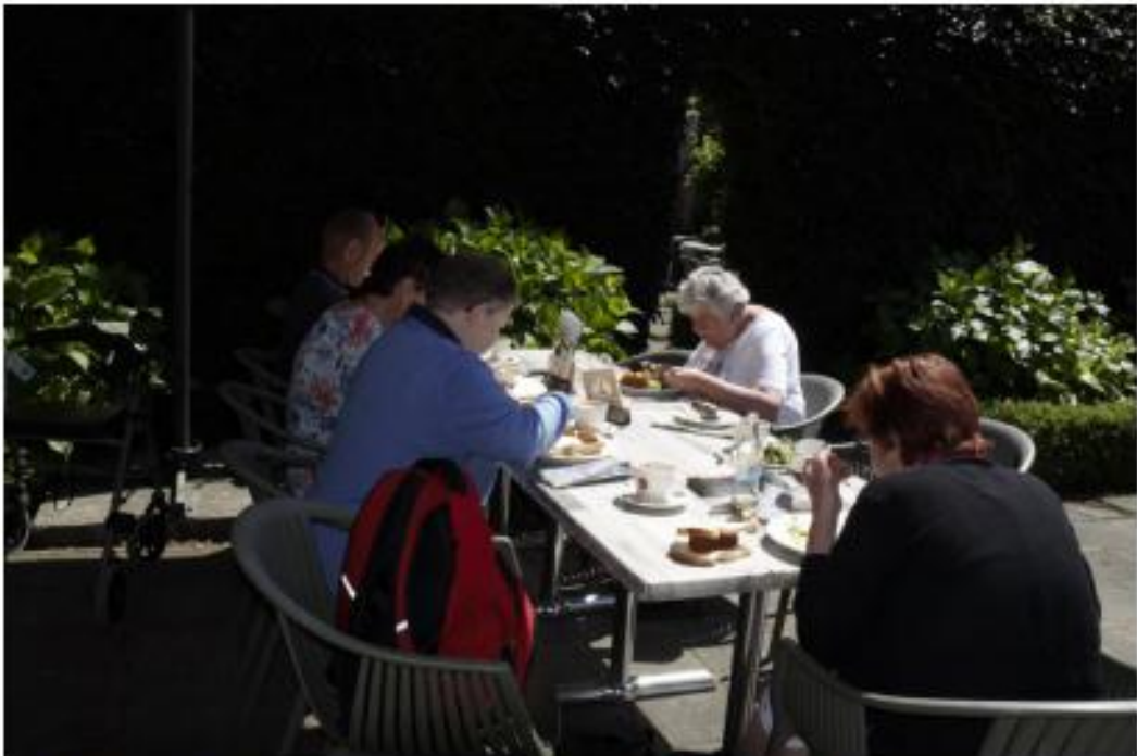
Lekker lunchen in de schaduw, heel gezellig en smakelijk, hm.....!