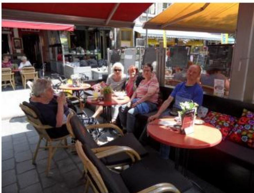
Moe van het lopen op de markt is zo'n terrasje toch wel een uitkomst

Moe van het rondlopen op deze mooie markt zochten wij een terras op voor een kop koffie/thee, een biertje en wat lekkers erbij. Heerlijk onder de parasols, vakantie.....Heel gezellig!