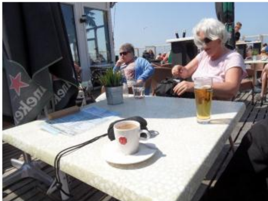
Tijd voor een terrasje : zon , zee en genieten maar.....