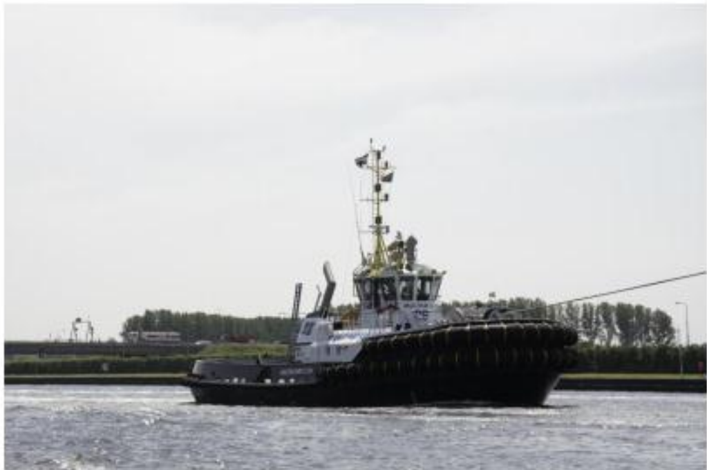
Een zg begeleidings schip zorgt er voor, dat het grote schip op koers blijft liggen