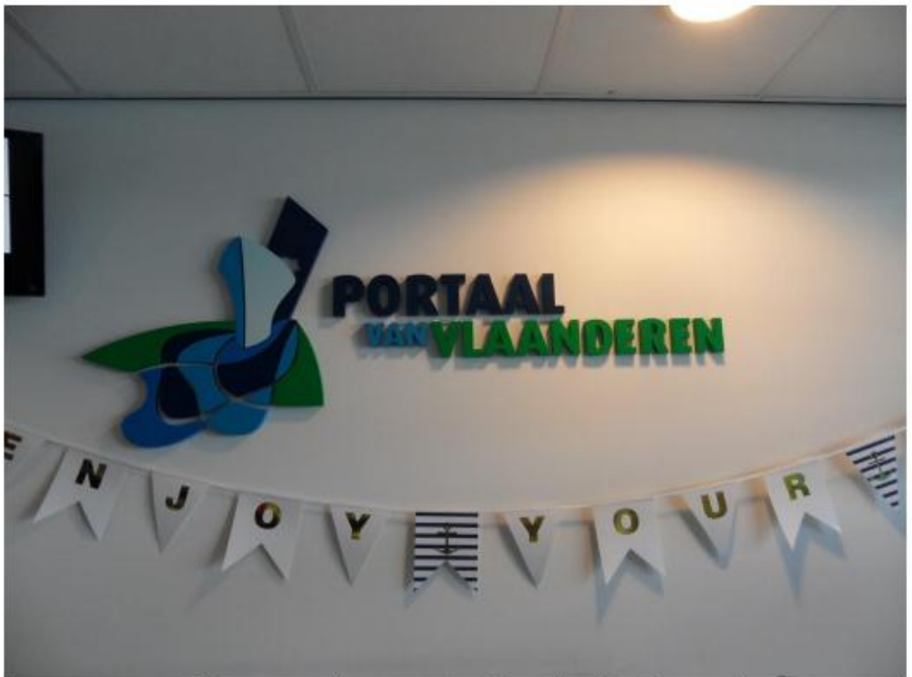
Deze naam - logo - staat op de wand achter de receptie

Zo rond 11.30 uur vertrokken wij mooi op tijd uit ons resort Haamstede en ruim voor het afgesproken tijdstip 13.30 uur kwamen wij aan bij het kantoor van Het Portaal van Vlaanderen. Wij werden allerhartelijkst ontvangen met een kop koffie/thee of wat fris .