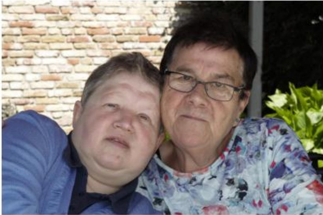
Twee vakantie vriendinnen : even " uitbuiken " na zo'n heerlijke lunch

Thuis in onze bungalow terug gekomen, gingen wij aan de slag om de koffers/bagage in te pakken voor de thuisreis de volgende dag, ja helaas, dat moest ook gebeuren.