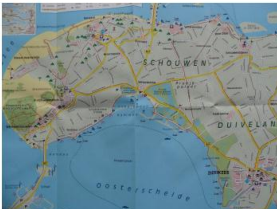
Gedeelte van het eiland Schouwen Duiveland met links in het midden Burgh-Haamstede

Het avondeten bestond uit heerlijke tomatensoep met broodjes.