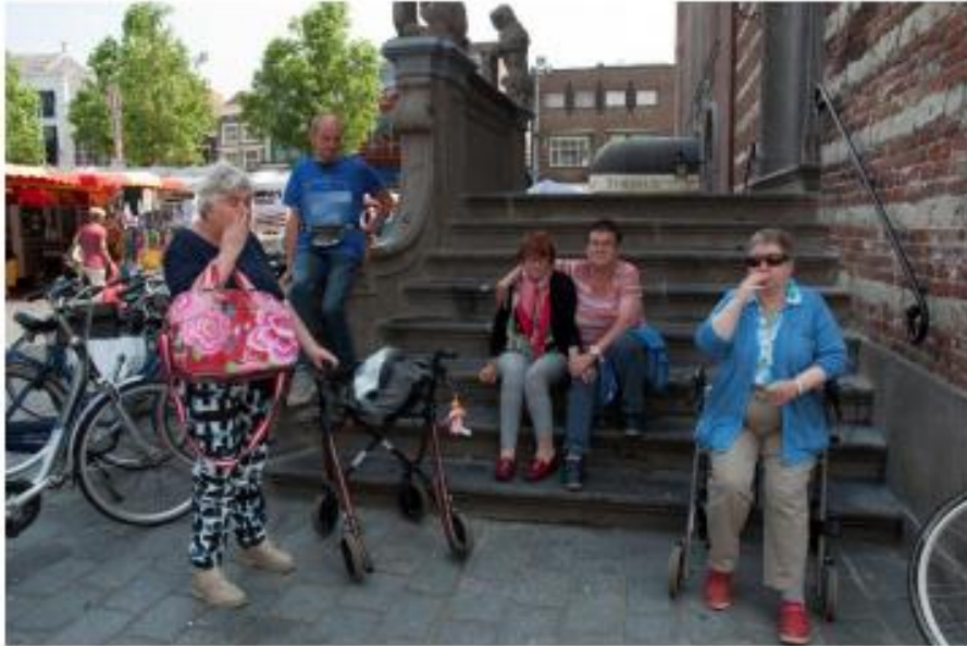
Even pauzeren in de schaduw van het voormalig gemeentehuis